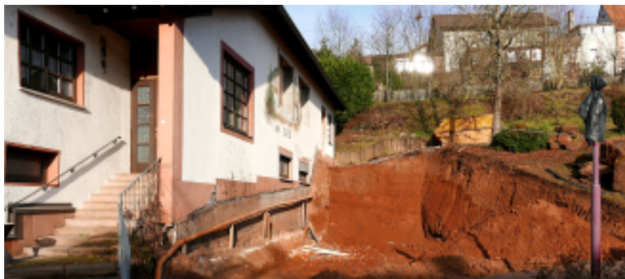
Bald barrierefrei: Vorbereitung für den neuen Aufzug

Alle Beschlüsse wurden einstimmig gefasst. (sr) 🐌