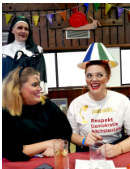
Witzig gemacht, ernst gemeint.