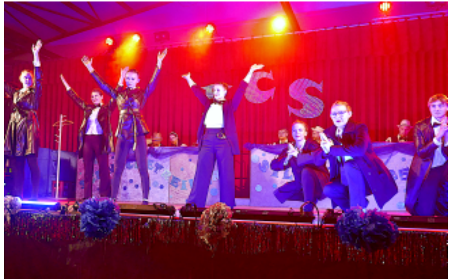
Die Schnecke-Show-"James Bond"-Tänzer