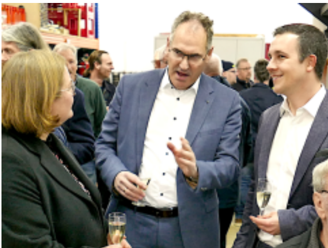
Landrat Dietmar Seefeldt und Verbandsbürgermeister Christian Burkhart (rechts) im Bürgergespräch