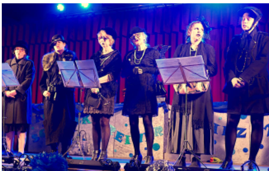
Die Tena-Ladies – mehr oder weniger in Trauer