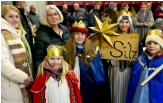
Eine kleine Gruppe Sternsinger und ihre Ansprechpartnerinnen vertraten die elf Kinder, die als "Könige" durchs Dorf gelaufen waren. Insgesamt haben sie 1408,50Euro gesammelt.