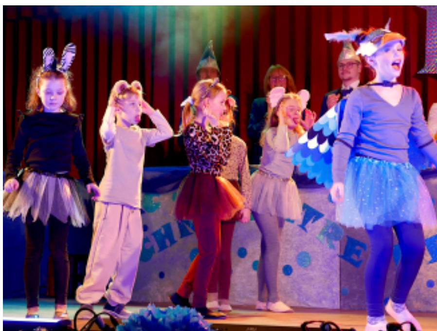
Die Zimtschneckelscher eröffneten goldig den Gardereigen.