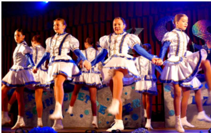
Sportlich und schick: die Seeschnecken. Mehr ab Seite fünf.