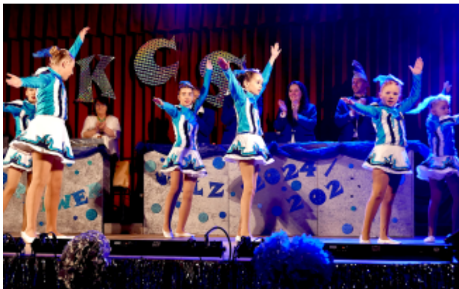
Die Zuckerschnecken – eine Augenweide.