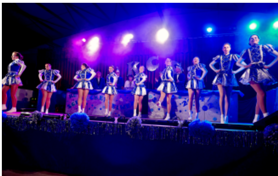
Die Schneckefunke mit den Tanzmariechen (3. und 4. von links)